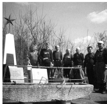
Bátonyterenyei szervezetünk tagjai tartják rendben a helyi temetőben a szovjet katonasírokat